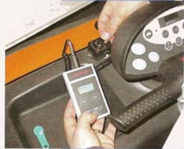
Le boîtier de prélèvement des données sur la machine

que 14 sur un mois ! "Celui qui collectionne le plus de chocs n'est pas forcément celui qui conduit le plus mal" déclare Jérôme Cèbe. "On est obligé de se livrer à une analyse. Il ne s'agit pas d'une opération presse bouton, il ne faut pas oublier que nous gérons des hommes !" poursuit-il. L'extraction mensuelle des données prend une dizaine de minutes au responsable logistique auxquelles s'ajoutent une vingtaine de minutes pour relever les infos de chacune des 20 machines du parc, à l'aide d'un boîtier de prélèvement (Data Ranger).