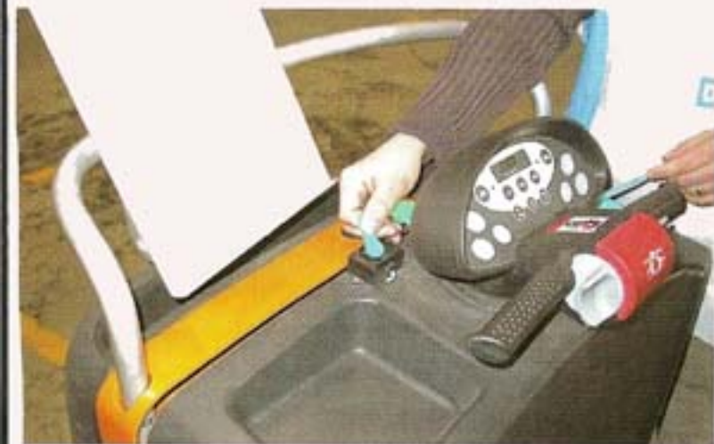
La clé nominale en contact avec la prise d'Impact Manager

que 14 sur un mois ! "Celui qui collectionne le plus de chocs n'est pas forcément celui qui conduit le plus mal" déclare Jérôme Cèbe. "On est obligé de se livrer à une analyse. Il ne s'agit pas d'une opération presse bouton, il ne faut pas oublier que nous gérons des hommes !" poursuit-il. L'extraction mensuelle des données prend une dizaine de minutes au responsable logistique auxquelles s'ajoutent une vingtaine de minutes pour relever les infos de chacune des 20 machines du parc, à l'aide d'un boîtier de prélèvement (Data Ranger).