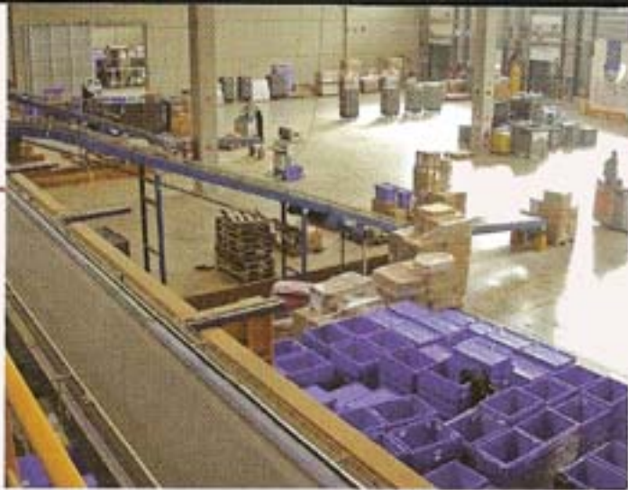
Une partie de la zone d'expédition de l'entrepôt Décathlon